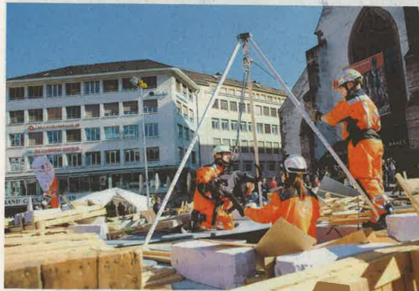
Übung. Der Rettungshund wird ins eingestürzte Haus heruntergelassen, um nach Menschen zu suchen. Sein sensibler Geruchssinn hilft ihm dabei.